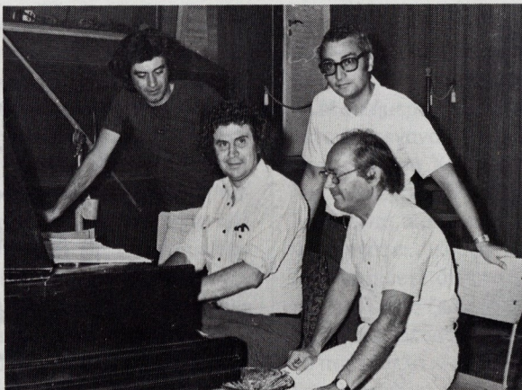
Τρίτη μέρα μετά την πτώση της δικτατορίας. Πρώτη ηχογράφηση του Μίκη Θεοδωράκη στην Ελλάδα και αποκλειστικό συμβόλαιο του Μίκη με τη ΜΙΝΩΣ. Από αριστερά, Αχιλλέας Θεοφίλου, Μίκης Θεοδωράκης, Μάκης Μάτσας και Νίκος Κανελλόπουλος.

S.: Για να φτάσουμε στο σημερινό «Από 'δω η γυναίκα μου κι από 'δω το αίσθημά μου».