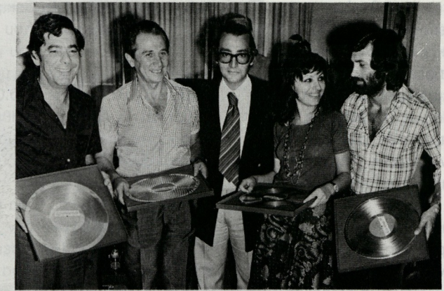
Απονομή χρυσών δίσκων για τη «Μικρά Ασία». Μαζί με τον Γιώργο Νταλάρα εμφανίζεται επίσημα για πρώτη φορά στη δισκογραφία και η Χαρούλα Αλεξίου. Με αυτή την απονομή, το 1972, καθιερώνεται ο «χρυσός δίσκος» στην Ελλάδα. Από αριστερά, Πυθαγόρας, Απ. Καλδάρας, Μάκης Μάτσας, Χάρης Αλεξίου και Γιώργος Νταλάρας.